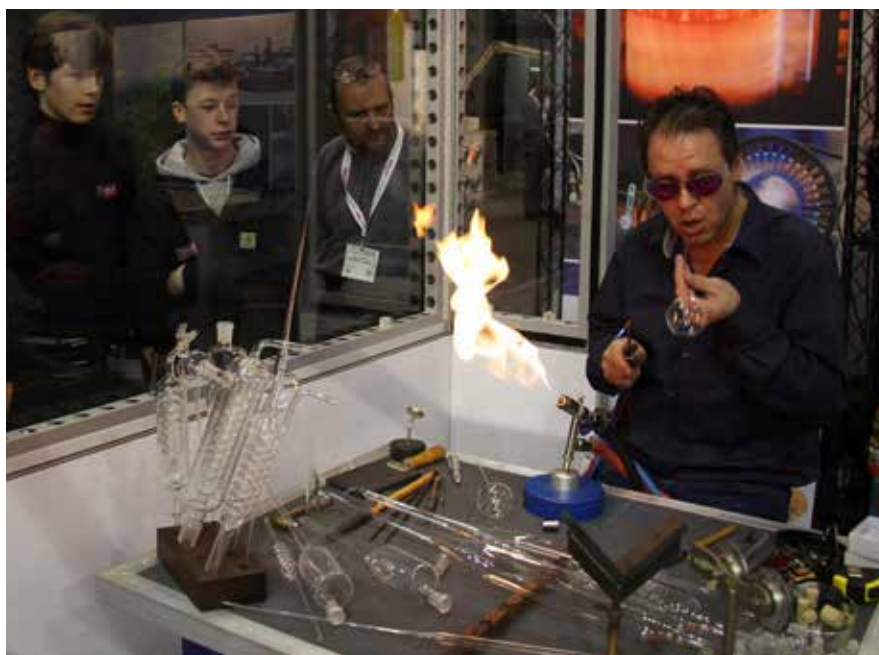
De nodige demo's kunnen verwacht worden op Welding Week

BIL is niet de enige partner van beursorganisatie Easyfairs. In samenwerking ook met VDAB vindt op de beurs bijvoorbeeld het Belgisch kampioenschap virtueel lassen plaatst. Belmetal, de Belgische beroepsvereniging van de metaalhandel, maakt tijdens de beurs de winnaar van de Steel Warriors awards. Dat is een wedstrijd waarin studenten aan een metaalopleiding het tegen elkaar opnemen.