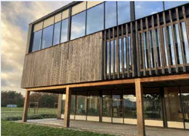
Aanzicht van de buitengevel met aluminium buitenschrijnwerk

Maar ook in het project Kamp C, circulair kantoorgebouw van provincie Antwerpen, ingediend door Beneens wordt aluminium gebruikt zowel voor de buitenafwerking, als structureel voor de verbinding van de kolommen en liggers van de hoofdstructuur. In dit project stonden circulariteit, demonteerbaarheid en toekomstig hergebruik voorraan in het ontwerp.