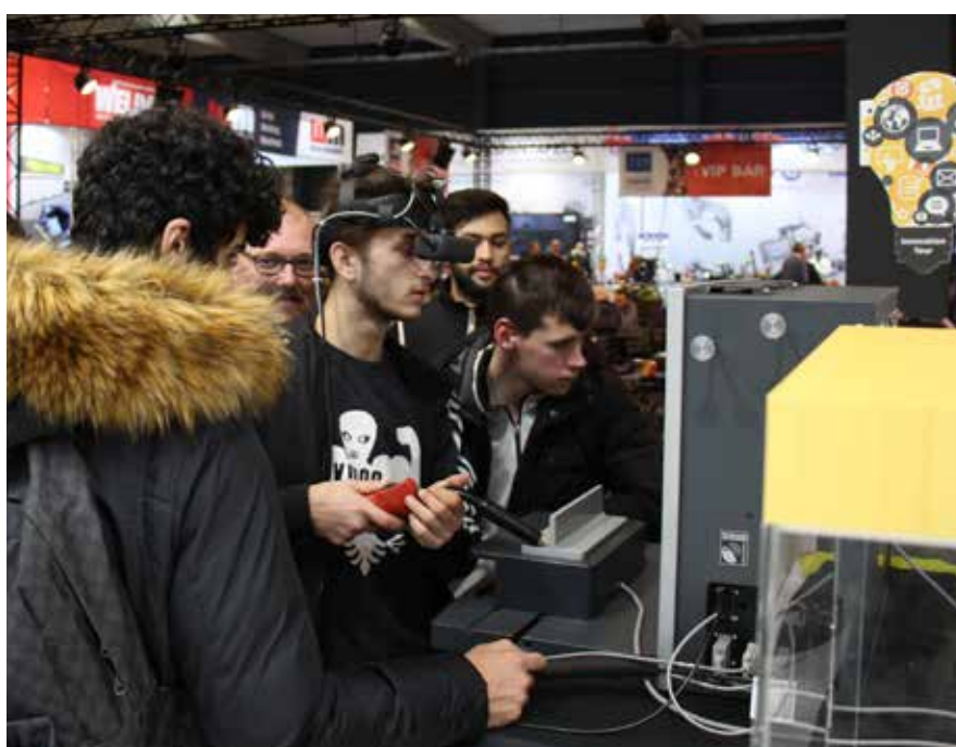
Tijdens de Welding Week vindt het kampioenschap Virtueel Lassen van de Lage Landen plaats