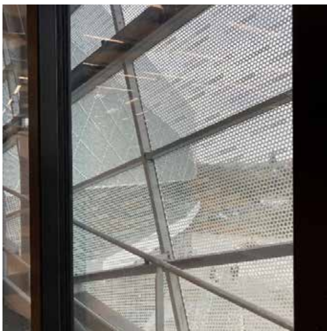
Geperforeerde zinken buitenbekleding bevestigd op de gevel