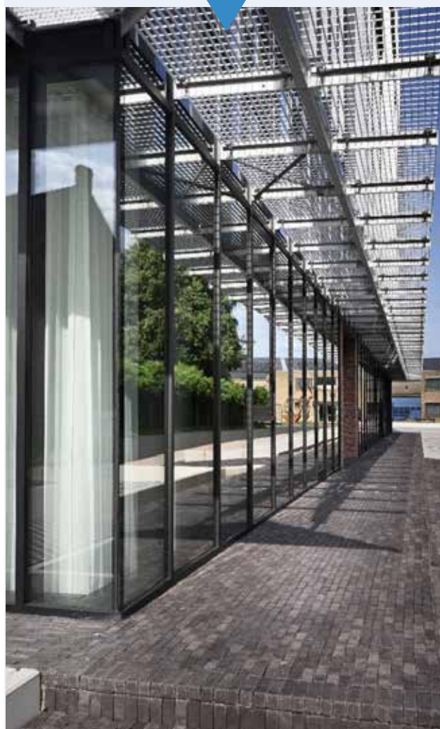
De hoekbeglazingen werden naadloos uitgevoerd

Ook werden de hoekbeglazingen (uitgevoerd met 3 voudige beglazing met lage Ug waarde van 0.6 W/m 2 K) naadloos uitgevoerd.