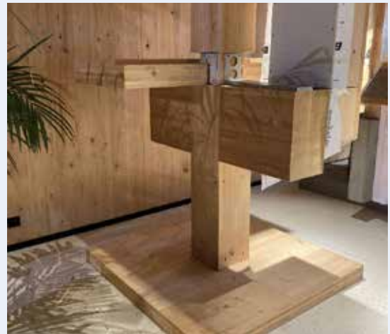
Demonteerbare (herbruikbare) knoop met kolom/ligger verbinding en structurele aluminium verbinding

Eens te meer tonen deze projecten aan dat aluminium constructies in combinatie met andere materialen, leiden tot gebouwen met een duurzame toekomst in de circulaire wereld van vandaag.